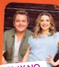
PLAY NO MODÃO