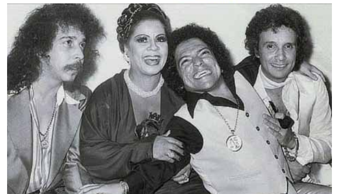
Benito Di Paula, Ângela Maria, Nelson Ned e Roberto Carlos - Anos 70

CHAME CHAME Acessórios para Celulares, Informática e Games