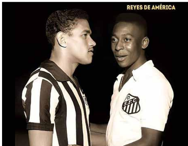
REYES DE AMÉRICA