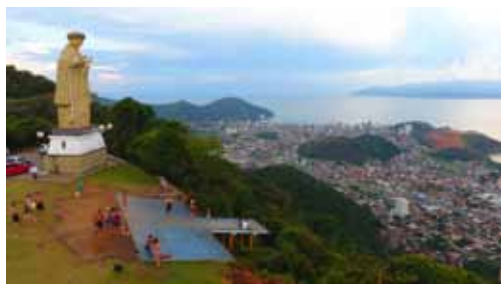
Antiga estatua de Santo Antonio

Foi agendado para o dia 8 de julho a missa campal e a inaugura-